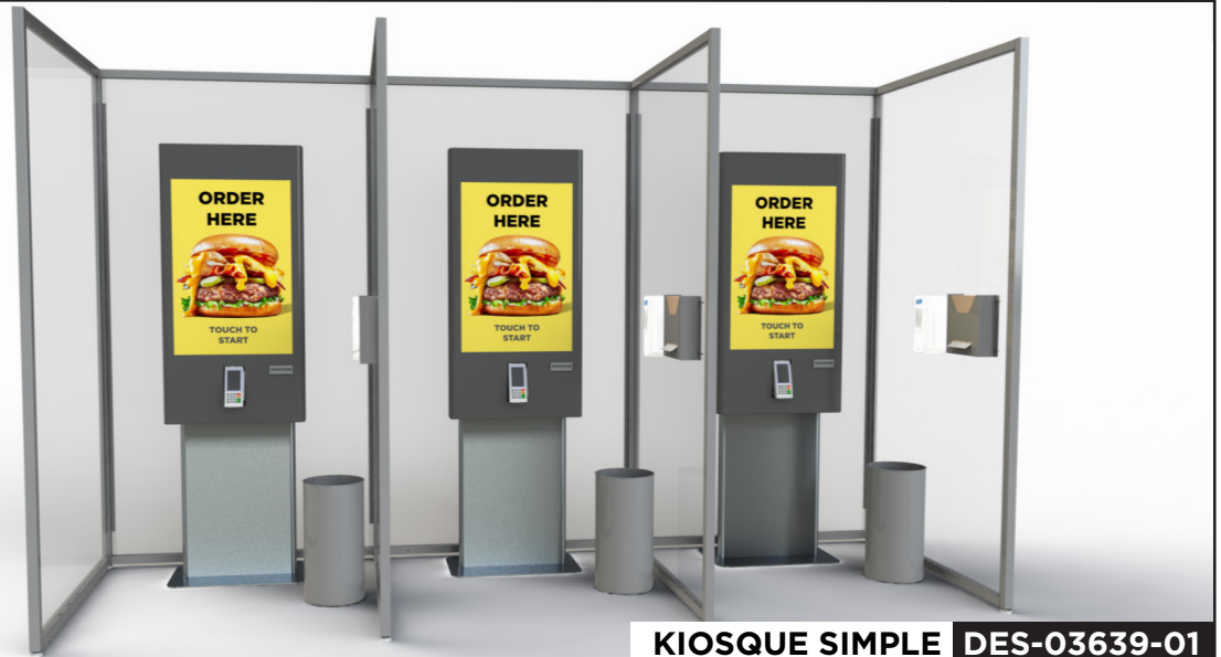
KIOSQUE SIMPLE DES-03639-01

Courriel pour les prix et les détails : sales@artitalia.com