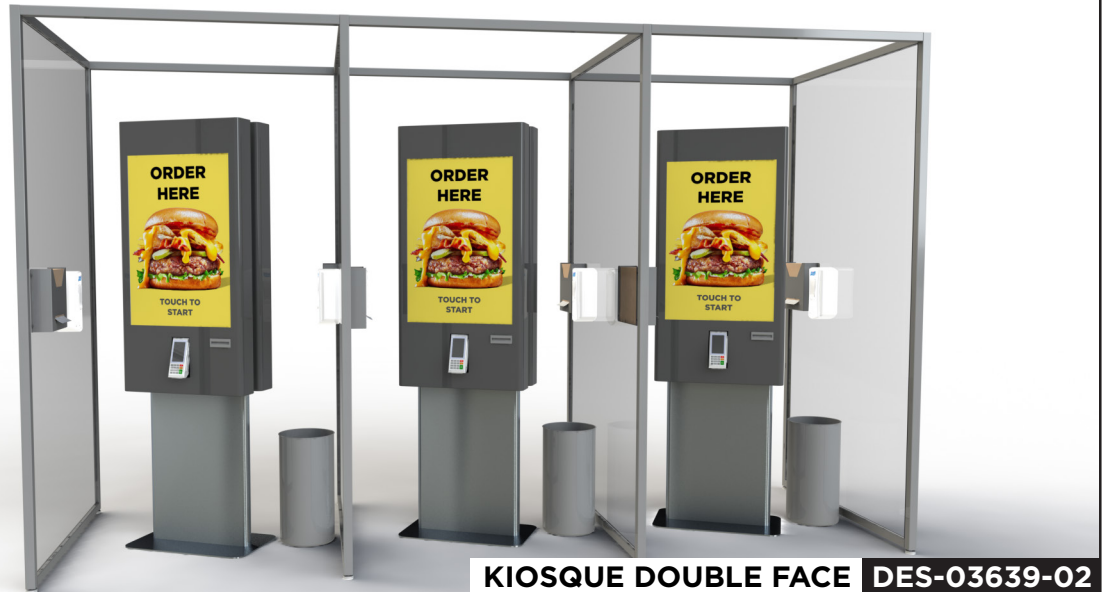
KIOSQUE DOUBLE FACE DES-03639-02

Stérilisateur : Revêtement germicide en poudre disponible sur demande. Des frais supplémentaires peuvent s'appliquer.