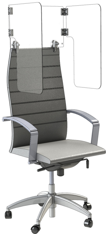
EN FORME DE « U » ET Pliable DES-03669-01