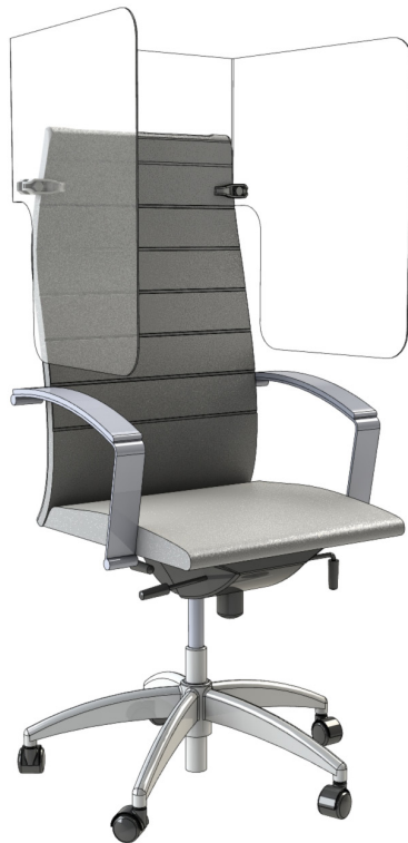
EN FORME DE « U » DES-03669-02