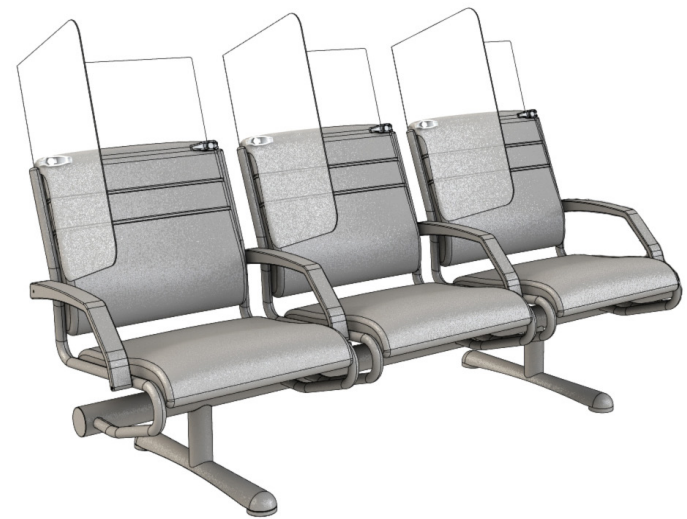
EN FORME DE « L » DES-03669-03